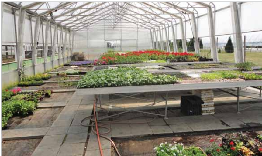
Slika 16. Plastenik u Gospodarskoj školi Čakovec