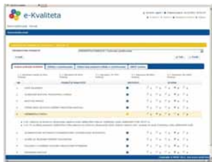
Slika 2: Samovrjednovanje po prioritarnim područjima i područjima kvalitete

e-Kvaliteta usko slijedi pristup kakav je opisan u Priručniku za samovrjednovanje (rujan, 2011.) koji služi za mjerenje uspješnosti ustanova za strukovno obrazovanje prema kriterijima kvalitete. Sadrži prioriteta područja i povezana područja kvalitete koja su navedena u Hrvatskom okviru za samovrjednovanje za strukovno obrazovanje i osposobljavanje te pruža jednostavan način unošenja rezultata koristeći ljestvicu od 5 stupnjeva pri donošenju prosudbi.