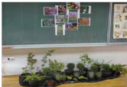
Slika 15. Izlaganje cvjećara na Dan otvorenih vrata u Gospodarskoj školi Čakovec

Razina sustava je razina na kojoj se određuju uvjeti strukovnog obrazovanja i osposobljavanja, regionalno i/ili nacionalno. Prema članku 13.1. Zakona o strukovnom obrazovanju (2009.) ASOO je odgovoran za sustav strukovnog obrazovanja i osposobljavanja u RH. Stoga, ASOO provodi vanjsko vrjednovanje 36 procesa samovrjednovanja ustanova, a odgovoran je i za razvoj postupaka i instrumenata za vanjsko praćenje ustanova za strukovno obrazovanje kao i za cijeli sustav.