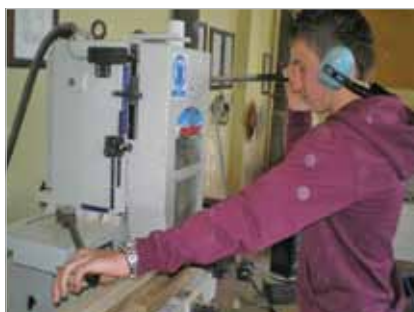
Slika 5. Drvodjeljski tehničar-dizajner u Šumarskoj i drvodjeljskoj školi Karlovac

Jedan od instrumenata osiguranja kvalitete je proces samovrjednovanja koji ustanove za strukovno obrazovanje trebaju provoditi tijekom svake školske godine. Viši savjetnici iz ASOO-a pružaju potporu i nadziru proces samovrjednovanja. U šk. god. 2010./11., u razdoblju od rujna do 15. srpnja, 24 su ustanove za strukovno obrazovanje testirale okvir za samovrjednovanje i s njim povezan priručnik za samovrjednovanje pod okriljem partnera u projektu ASOO-a.