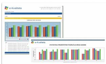
Slika 4: Nacionalni komparativni grafikon

Na nacionalnoj je razini e-Kvaliteta snažan alat koji omogućuje stručnjacima u području strukovnog obrazovanja i osposobljavanja analiziranje kvalitete u tom sektoru u RH. Aplikacija pruža pristup svim izvješćima o samovrjednovanju, zbirkama dokaza i komparativnim grafikonima. Stručnjaci također mogu komunicirati s ustanovama za strukovno obrazovanje koristeći