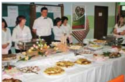
Slika 13. Konobari predstavljaju jela kuhara u Obrtničkoj školi Koprivnica

Ustanove su odgovorne za kvalitetu odgojno-obrazovnoga procesa kojega pružaju. Njihova glavna svrha je pomoći polaznicima da steknu kompetencije; stoga je kvalitetno učenje jedini i najvažniji čimbenik koji utječe na uspjeh ustanove i njezinih polaznika. Kao dio svojih internih procesa osiguranja kvalitete, ustanove trebaju razviti i uspostaviti sustav upravljanja kvalitetom te ga kontrolirati s pomoću internih procedura praćenja . Čitav sustav i organizacija ustanove za strukovno obrazovanje procjenjuju se svake godine kroz proces samovrjednovanja, nakon čega se piše izvješće o samovrjednovanju, godišnji plan unaprjeđenja i nadopunjuje se cjelokupni tro do petogodišnji razvojni plan ustanove.