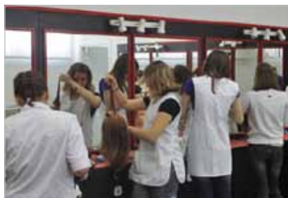
Slika 14. Frizerski praktikum Gospodarske škole Čakovec

Povratne informacije i postupci za promjene dio su sustavnoga i cilju usmjerena procesa koji se koristi za mijenjanje planova i razvoj aktivnosti kako bi se postigli ciljani ishodi i kako bi se odredili novi ciljevi. Cilj je učiti iz informacija (npr. rezultata), koje su dobivene na različite načine i kroz raspravu i njihovu analizu zajedno s ključnim dionicima. Može se učiti i iz primjera dobre prakse tako što ustanova uspoređuje svoje aktivnosti s takvim primjerima.