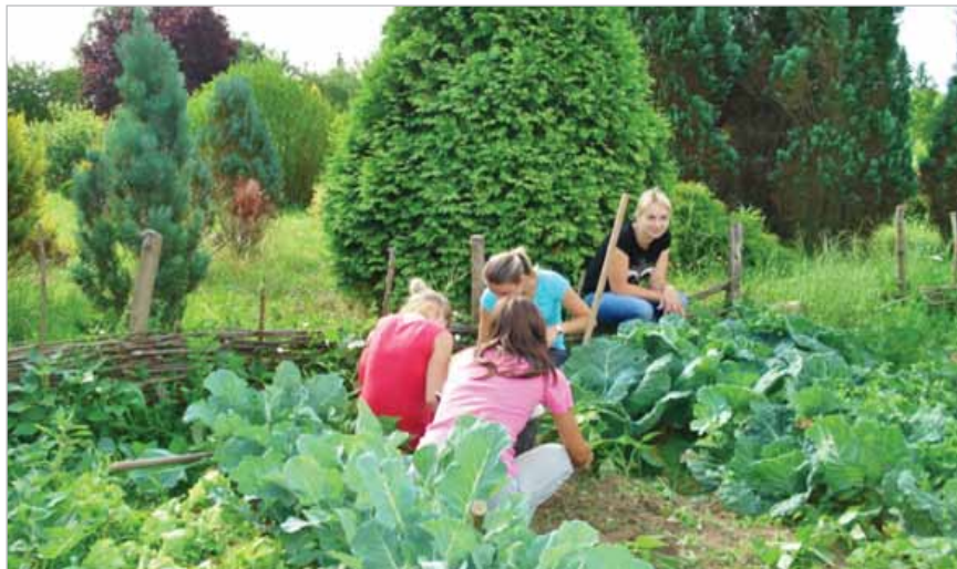
Slika 17. Praktična nastava u Srednjoj školi „Arboretum Opeka“, Marčan - Vinica

Dokazi ili podatci osnova su za donošenje odluka na svim razinama. U prvom redu, kako bi se samovrjednovanje provodilo profesionalno, potrebno je usmjeravanje kako bi ustanove znale što se od njih očekuje da postignu ili unaprijede (okvir s kriterijima). Zatim, uspoređivanje rezultata ustanova s referentnim mjerilima (kroz samovrjednovanje i vanjsko praćenje) drugi je važan instrument upravljanja budući da je ključna riječ unaprjeđenje . Treće, uspostava sustava za mjerenje i evidentiranje relevantnih rezultata (ključni pokazatelji uspješnosti) je preduvjet za pružanje podrške ustanovama u njihovu unaprjeđivanju usluga strukovnog obrazovanja i osposobljavanja.