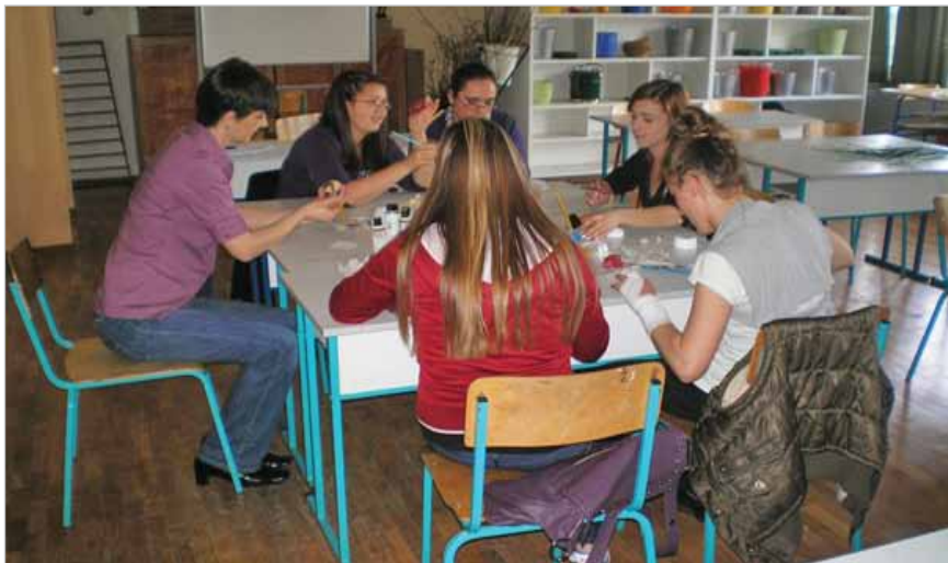
Slika 9. Aranžeri interijera cvijećem u Poljoprivrednoj školi Zagreb (1)