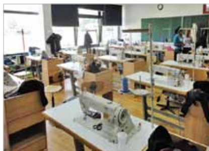
Slika 19. Krojački praktikum u Gospodarskoj školi Čakovec

U RH za prve godine nacionalne provedbe Okvira za samovrjednovanje za SOO (2011./12.), 24 škole se - kao sudionice u pilot-projektu - mogu dodijeliti ostalim ustanovama kao „mentori“. Budući da su te škole već prošle prvi ciklus samovrjednovanja, mogle bi iskoristiti to iskustvo i pružiti savjete ostalim ustanovama. Od takvoga „mentorskoga“ sustava u budućnosti bi se mogla razviti regionalna mreža ustanova za strukovno obrazovanje.