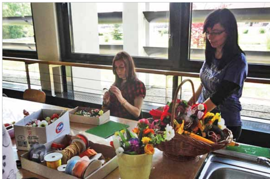
Slika 21. Cvjećari u Gospodarskoj školi Čakovec