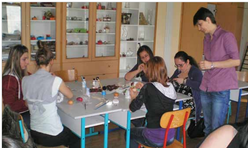
Slika 10. Aranžeri interijera cvijećem u Poljoprivrednoj školi Zagreb (2)

Pristup okvira za samovrjednovanje usmjeren je na stvaranje i razvoj nove dimenzije kvalitete, a cilj mu je pružati podršku ustanovama za strukovno obrazovanje u njihovim nastojanjima da ponude visokokvalitetno obrazovanje i osposobljavanje. Bit procesa je promicanje kontinuiranog unaprjeđenja kvalitete u ozračju otvorenosti i međusobnoga povjerenja kojima se pridonosi transparentnosti i usporedivosti na europskoj razini. Cijeni se dobra praksa i potiče međusobno učenje u procesu koji je dinamičan i poticajan te koristan ustanovama i ASOO-u.