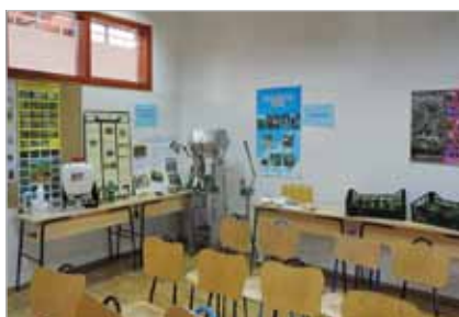
Slika 18. Oprema za poljoprivredne tehničare u Gospodarskoj školi Čakovce

Članak 2. Zakona o stručno-pedagoškom nadzoru (1997.) navodi da je "stručno-pedagoški nadzor sustavno i organizirano stručno praćenje ostvarivanja propisanih [ nastavnih ] planova i programa, organizacije i izvođenja nastave i [ praktične nastave ] te drugih [ strukovnih ] aktivnosti u ustanovama za strukovno obrazovanje te stručnog i pedagoškog rada nastavnika i stručnih suradnika [( pedagog, psiholog, defektolog, profesionalno usmjeravanje, posebne potrebe )]".