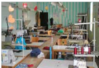
Slika 20. Krojački praktikum u Obrtničkoj školi Sisak

Jedan vrlo obećavajući instrument osiguranja kvalitete i razvoja je međusobno revidiranje ( engl. Peer Review ) – vanjsko praćenje ustanova za strukovno obrazovanje koje provode kolege iz druge srodne ustanove. Trenutačne se postavke osiguranja kvalitete u Europi također usmjeravaju na međusobno revidiranje. Europski priručnik za međusobno revidiranje 38 , objavljen 2007. i namijenjen inicijalnom strukovnom obrazovanju, proširit će se i na ostale segmente strukovnog obrazovanja i osposobljavanja. Međusobna revizija i međusobno učenje putem mreža ustanova mogli bi u budućnosti zamijeniti vanjsko praćenje, iako bi potvrđivanje izvješća o samovrjednovanju ustanove i plana unaprjeđenja i dalje trebalo biti u nadležstvu ASOO-a.