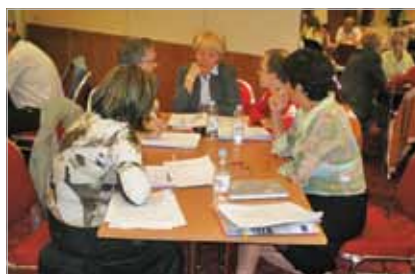
Slika 8. Radionica za članove Povjerenstva za kvalitetu iz pilot-škola (rujan, 2010.)

ASOO je razvio Informacijski sustav strukovnog obrazovanja i osposobljavanja – VETIS – koji objedinjava i omogućuje obradbu svih bitnih podataka o strukovnim školama, učenicima, djelatnicima, školskoj opremi, školskim zgradama i prostorima, učeničkim domovima, prijavama učenika na natjecanja, prijavama nastavnika na stručne skupove itd., potrebnih za analizu, planiranje i upravljanje strukovnim obrazovanjem i osposobljavanjem. Moduli u VETIS-u su: