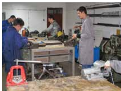
Slika 6. Učenici u školskoj radionici za praktičnu nastavu strojarstva u Strukovnoj školi Gospić

Prema povratnim informacijama koje su prikupljene za i nakon pilot-faze, 95% pilot-ustanova preporučilo bi posjete u svrhu vanjskog praćenja drugim ustanovama. Sve su ustanove potvrdile da proces samovrjednovanja ne bi bio moguć bez podrške vanjskog pratitelja. Također su naglasile da su vanjski pratitelji bili od iznimne važnosti kao „treća strana“ koja daje povratne informacije i realne procjene o njihovom radu.