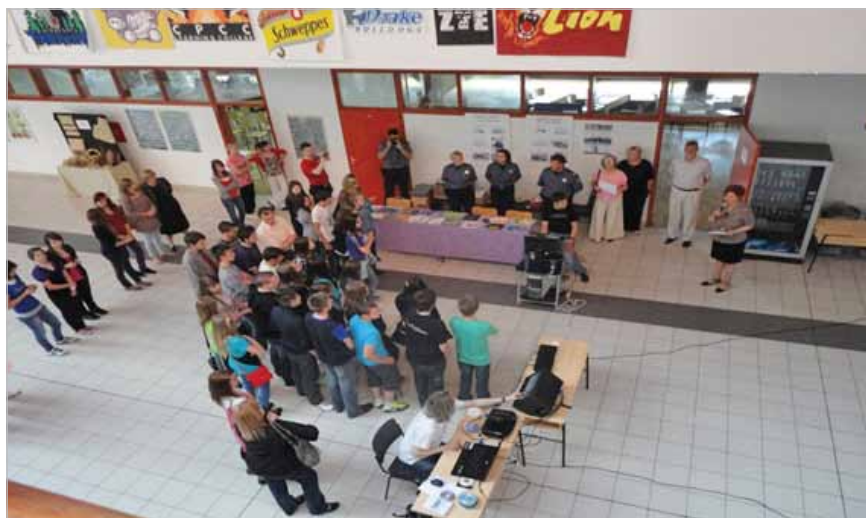
Slika 4. Otvaranje Dana otvorenih vrata u Gospodarskoj školi Čakovec

Kada je u veljači 2009. godine donesena odluka o proglašenju Zakona o strukovnom obrazovanju , sve su ustanove za strukovno obrazovanje postale obvezatne provoditi samovrjednovanje i vanjsko vrjednovanje (članak 11.1). Međutim, do ožujka 2010. godine nisu sve ( od 271 ) strukovne škole uvele godišnji ciklus samovrjednovanja.