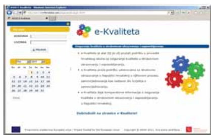
Slika 1: Dobrodošli na e-Kvalitetu

e-Kvaliteta je internetski alat kojemu se može pristupiti putem ASOO-ve internetske stranice ( www.asoo.hr ) i dio je Hrvatskog okvira za osiguranje kvalitete za strukovno obrazovanje i osposobljavanje . Alat je razvijen u sklopu projekta „Razvoj osiguranja kvalitete u strukovnom obrazovanju i osposobljavanju“, financiranome putem IPA-ine Komponente IV – Razvoj ljudskih potencijala – Program EU-a za Hrvatsku.