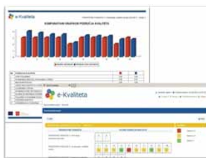
Slika 3: Komparativni grafikon i utvrđena područja za unaprjeđenje

Podnošenjem svojih izvješća o samovrjednovanju, e-Kvaliteta omogućuje ustanovama za strukovno obrazovanje praćenje svoje vlastite uspješnosti usporedbom svojih rezultata s rezultatima drugih ustanova te – s pomoću grafičkoga prikaza – utvrđivanje područja za unaprjeđenje. Dodatni komparativni statistički grafikon – koji se temelje na prosječnim rezultatima po županiji ili po sektoru – nude više detaljnijih informacija. Svi grafički prikazi i grafikonu mogu se preuzeti i ispisati tako da ih povjerenstva za kvalitetu mogu koristiti kao temelj za daljnje rasprave i analize.