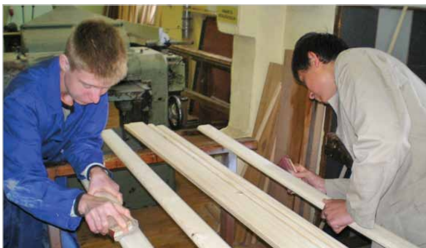
Slika 7. Stolari u Obrtničkoj školi Sisak

Preporuka je da bi u provedbi svojih aktivnosti sva tijela, agencije i organizacije trebale djelovati na način kojim pokazuju poštovanje prema intelektualnoj i operativnoj fleksibilnosti i raznolikosti ustanova za strukovno obrazovanje, čime bi priznale važnost pružanja kvalitetnih usluga strukovnog obrazovanja u osobnim, profesionalnim i ekonomskim životima pojedinaca, ali i zajednice, a time prepoznale važnosti uključivanja u europske i druge međunarodne tokove.