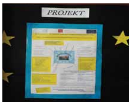
Slika 3. Pano o projektu „Razvoj osiguranja kvalitete u strukovnom obrazovanju i osposobljavanju” u Srednjoj strukovnoj školi Varaždin

Kao što je već spomenuto, Republika Hrvatska je tek na početku usvajanja europskih dostignuća u području osiguranja kvalitete u SOO-u. U ožujku 2010. godine EQARF je prilagođen nacionalnom kontekstu i prijedlog Okvira za kvalitetu u SOO-u razvijen je zajedno s Okvirom za samovrjednovanje koji se temelji na Europskom vodiču za samovrjednovanje pružatelja SOO-a 20 . Od ožujka 2010. do ožujka 2012. godine Republika Hrvatska je, uz pomoć projekta IPA Razvoj osiguranja kvalitete u strukovnom obrazovanju i osposobljavanju , financiranome sredstvima Europske unije, i partnera u projektu ASOO-a, izradila, testirala i revidirala instrumente osiguranja kvalitete za sustav SOO-a .