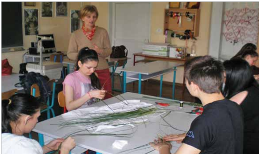
Slika 11. Aranžeri interijera cvijećem u Poljoprivrednoj školi Zagreb (3)

Transparentnost je važno sredstvo kojim se javne službenike i zaposlenike drži odgovornima , i to je sredstvo kojim se sprječava korupcija. Transparentnost sustava strukovnog obrazovanja i osposobljavanja trebala bi povećati kako povjerenje glavnih korisnika i drugih dionika tako i kredibilitet svjedodžbi koje se izdaju polaznicima.