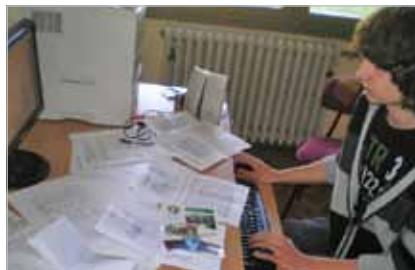
Slika 12. Meteorološki tehničari u Šumarskoj i drvodjeljskoj školi Karlovac

Izrađeni su materijali koji sadrže smjernice; a ravnatelji ustanova, koordinatori kvalitete i vanjski pratitelji prošli su edukaciju kako bi mogli koristiti tu dokumentaciju. Za vrijeme pilot-faze, koja je započela u rujnu 2010. godine, ustanove su procjenjivale i proces samovrjednovanja i dokumentaciju. Ukupno šest jednodnevnih posjeta sa svrhom pomaganja pilot-procesa i dva dvodnevna formalna posjeta u svrhu vanjskoga praćenja obavljena su u ustanovama koje su sudjelovale u pilot-procesu.